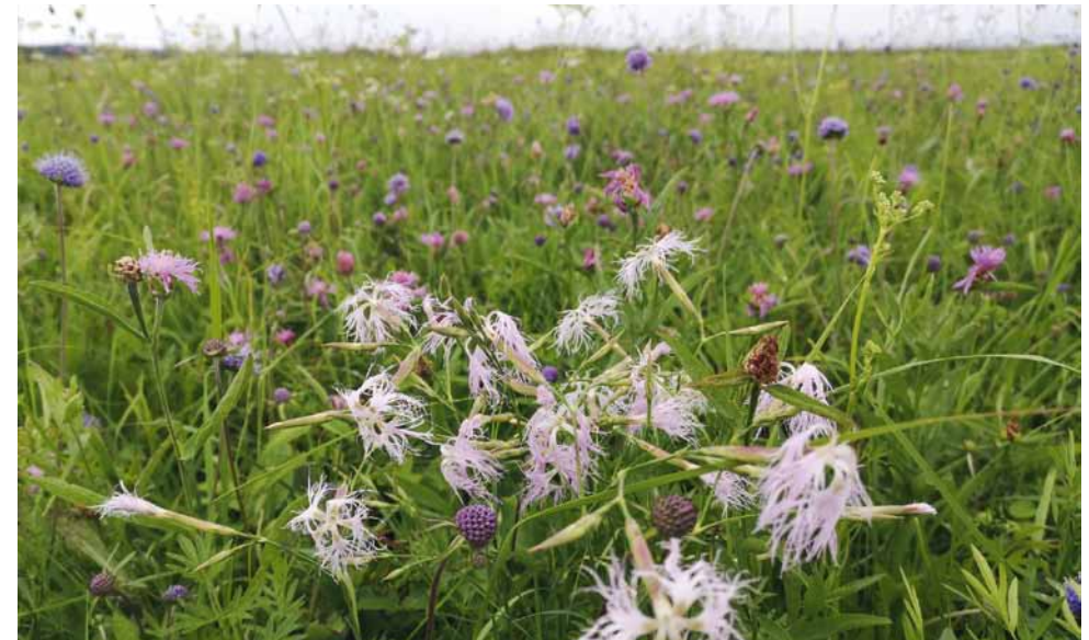
Prachtnelke und Teufelsabbiss sind Kennarten der Pfeifengraswiese (LRT 6410).

Pfeifengraswiesen kommen auf nährstoffarmen, wechselfeuchten Standorten vor. Viele Arten der Gesellschaft sind mittlerweile selten geworden. Pfeifengraswiesen haben ihre Hauptblütezeit im Spätsommer und blühen somit später als die typischen Wiesenarten. Daher sollte die zweite Nutzung auch entsprechend später (ab September) stattfinden. Kennarten sind z. B. Heil-Ziest, Prachtnelke, Dolden-Habichtskraut, Sumpf-Platterbse, Wiesen-Alant, Kümmel-Silge, Wiesen-Silge, Färberscharte oder Teufelsabbiss.