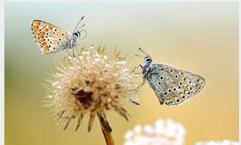
Kräuter sind vor allem als Lebensraum für unsere heimischen Insekten wichtig.

Um einen hohen Kräuteranteil in einer Wiese zu etablieren, müssen die Bedingungen an das Wachstum der Kräuter angepasst werden. Die meisten Wiesenpflanzen benötigen gerade in der Anfangszeit viel Licht zum Wachsen. Kräuter wachsen in der Regel langsamer als Gräser. Viele bilden im ersten Jahr erstmal eine Grundrosette und blühen erst ab dem zweiten Jahr. Durch das langsamere Wachstum besteht die Gefahr, schnell von Gräsern überragt und beschattet zu werden. Dies kann ihr Wachstum hemmen.