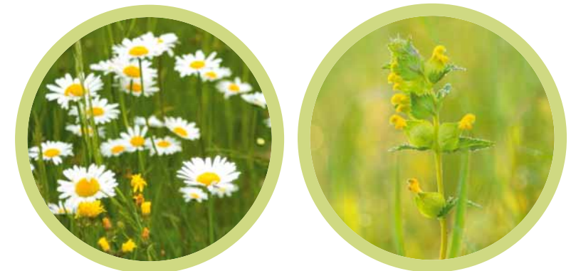
Margeriten und Klappertöpfe sind Zeigerpflanzen für magere Standorte.

Nährstoffzeiger treten z. B. besonders bei einer hohen Stickstoffverfügbarkeit auf und fehlen auf mageren Standorten. Störzeiger weisen auf ein nicht intaktes Ökosystem hin, in welchem regelmäßige Störungen auftreten. Auf einer artenreichen Fläche sind tendenziell wenige Nährstoff- oder Störzeiger und dafür mehr Magerkeitszeiger vorhanden.