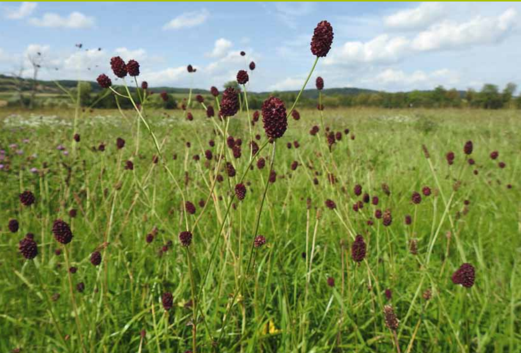
Der Große Wiesenknopf zur Blütezeit.