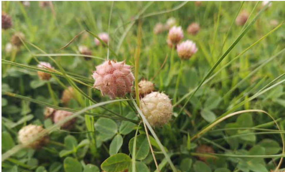
Der Erdbeerklee ist eine Zeigerart der Binnenland-Salzwiesen (LRT *1340).

Natürlich entstandene Binnenland-Salzwiesen sind besonders selten und daher im Wetteraukreis ein prioritärer Lebensraumtyp. Sie entstehen durch salzhaltiges Wasser im Untergrund. Dieser Lebensraumtyp lässt sich sehr gut beweiden. Kleine Trittstellen fördern sogar die Salzarten. Typische Salzarten sind z. B. Salz-Binse, Erdbeerklee, Strand-Dreizack, Salz-Schuppenmiere oder Salz-Hornklee.