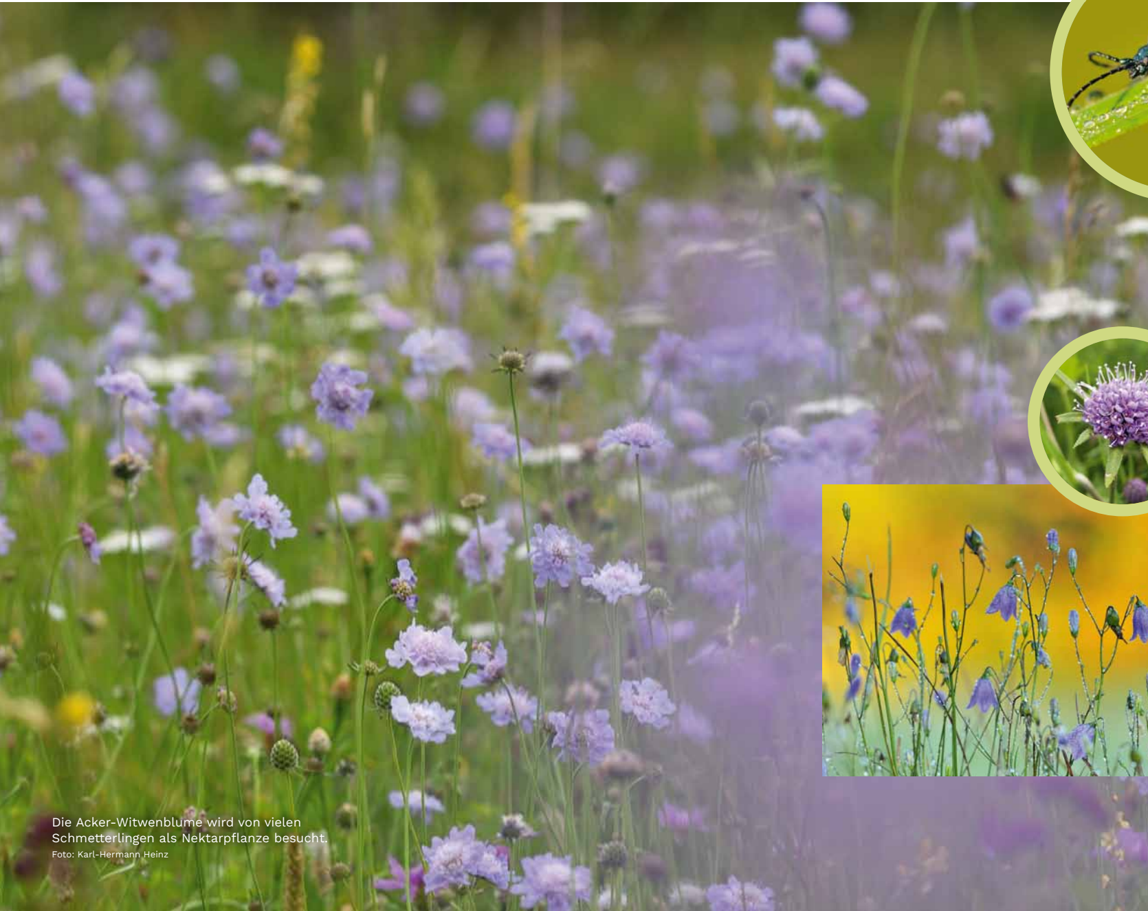
Die Acker-Witwenblume wird von vielen Schmetterlingen als Nektarpflanze besucht.