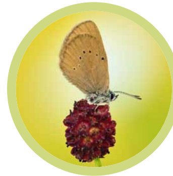
Ein Wiesenknopf-Ameisenbläuling auf der Blüte vom Großen Wiesenknopf.

Der Wiesenknopf-Ameisenbläuling (es gibt zwei Arten) ist ein Schmetterling mit einem sehr speziellen Lebenszyklus. Er ist dadurch sehr selten und wird durch die FFH-Richtlinie besonders geschützt. Der Wiesenknopf-Ameisenbläuling ist auf das Vorkommen von blühendem Großem Wiesenknopf (Pflanze) zur Flugzeit Juli/August angewiesen. Damit dieser genau zu dieser Zeit in der Blüte ist, ist ein vorhe-riger (früherer) Schnitt notwendig. Die Empfehlungen sind daher ähnlich wie beim Vorkommen von Pfeifengraswiesen, wenn auch aus anderen Gründen.