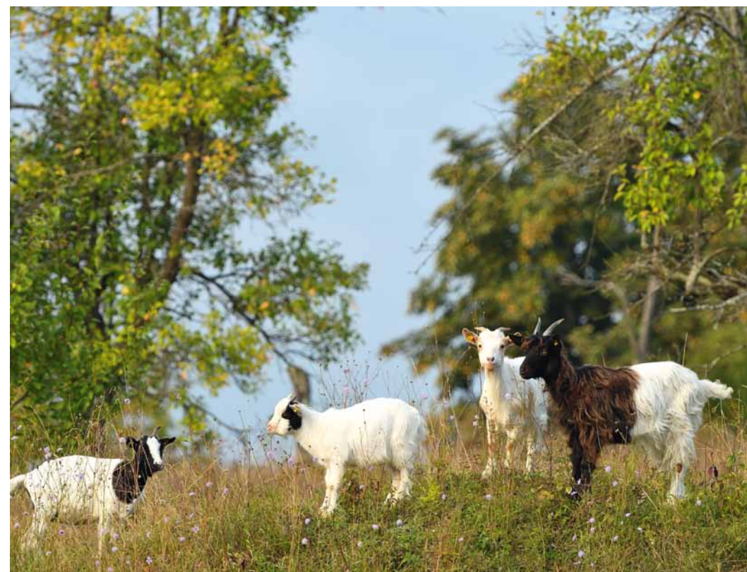
Ziegen übernehmen die Landschaftspflege.