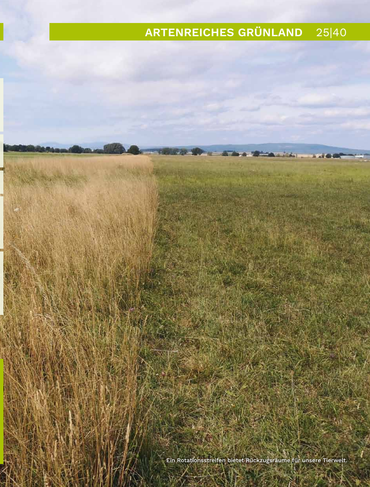
Ein Rotationsstreifen bietet Rückzugsräume für unsere Tierwelt.

Hinweis: Es wird immer wieder Flächen geben, die trotz extensiver Nutzung und Bemühungen nicht die gewünschte Artenvielfalt mit sich bringen. In diesen Fällen kann es sein, dass das Artenreservoir, gerade von Kräutern, nicht mehr im Boden oder auf Nachbarflächen vorhanden ist. Über Nachsaaten, Initialsaaten oder Mahdgutübertragungen kann das Artenpotenzial auf der Fläche wieder erhöht werden. Dies sind jedoch aufwändigere Maßnahmen und es gibt einiges zu berücksichtigen. Je nach Ausführung sind zudem Ausnahmeregelungen von den zuständigen Behörden notwendig. Wir empfehlen, sich vorab ausgiebig zu informieren oder beraten zu lassen.