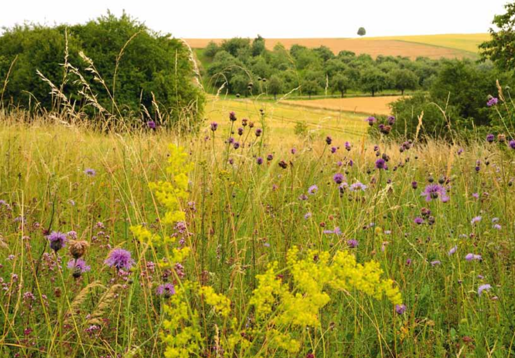
Eine artenreiche Wiese zeichnet sich durch eine hohe Farbvielfalt aus.