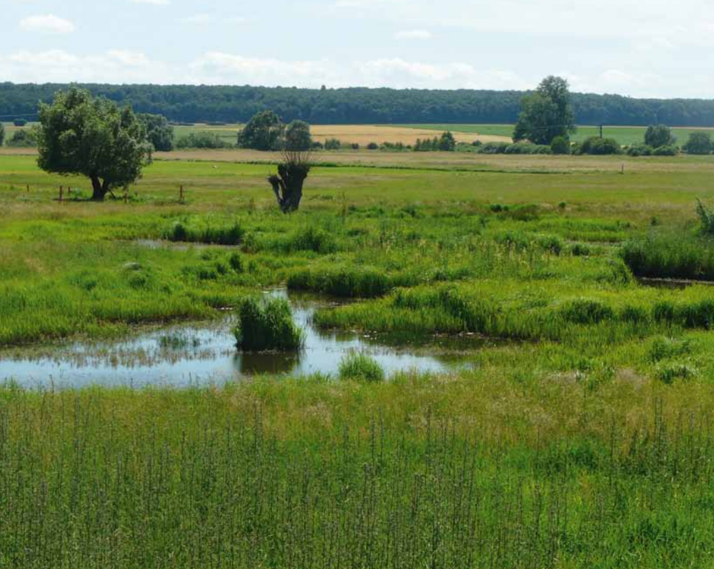
Artenreiches Feuchtgrünland im FFH-Teilgebiet „Mähried bei Staden“.