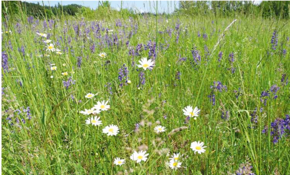
Eine Magere Flachlandmähwiese (LRT 6510) mit Wiesen-Salbei und Wiesen-Margerite.

Magere Flachlandmähwiesen sind blütenreiche Frischwiesen, die einst charakteristisch für unsere Landschaft waren. Typische Kennarten sind Wiesen-Glockenblume, Wiesen-Pippau, Weißes Labkraut, Wiesen-Storchenschnabel oder Wiesen-Bocksbart.