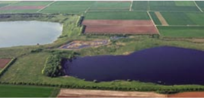
Luftbild des Naturschutzgebietes

Beinahe wie ein Schmetterling sehen die drei Wasserflächen des Naturschutzgebietes „Teufelsee und Pfaffensee“ aus der Luft aus. Vielleicht ein erster Hinweis darauf, dass diese Fläche heute für bedrohte Tier- und Pflanzenarten reserviert ist. Doch das war nicht immer so: