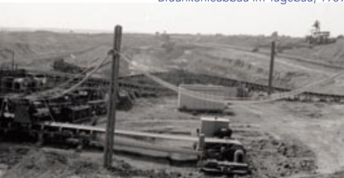
Braunkohleabbau im Tagebau, 1989

Während viele „Narben“ des ab 1962 ausschließlich im Tagebau betriebenen Abbaus der Braunkohle wieder verheilt sind und die Landschaft kaum noch Zeugnisse des Bergbaus aufweist, ist dieses Naturschutzgebiet eine Art Fenster