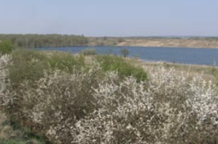
Hecken umfassen das Naturschutzgebiet

Unter der Bezeichnung „Teufelsee und Pfaffensee zwischen Echzell und Reichelsheim-Weckesheim“, wurde das Naturschutzgebiet im Wesentlichen auf Betreiben der HGON am 12. Januar 1998 ausgewiesen. Das Gebiet, mit einer Fläche von rund 91 Hektar, liegt innerhalb der Gemarkungen Gettenau der Gemeinde Echzell und Weckesheim der Stadt Reichelsheim. Es ist Bestandteil von NATURA 2000, dem zusammenhängenden Netz europäischer Schutzgebiete (Fauna-Flora-Habitat „Grünlandgebiete der Wetterau“ und Vogelschutzgebiet „Wetterau“). Die darin eingebundenen Schutzgebiete dienen der Erhaltung und dem Schutz der Vielfalt der Tier- und Pflanzenarten und ihrer natürlichen Lebensräume.