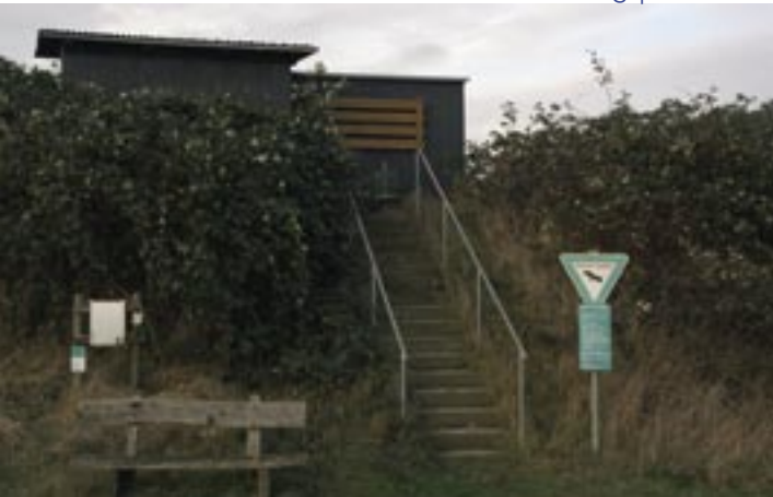
Eine der drei Beobachtungsplattformen

Zu erreichen ist das Gebiet über verschiedene, befestigte Feldwege. Um eine Störung der dort rastenden und brütenden Vögel zu vermeiden, ist die Betretung verboten. Für Beobachtungen stehen drei überdachte Plattformen zur Verfügung.