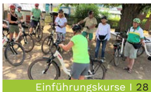
Einführungskurse | 28

* €5,00 Rabatt für Teilnehmende mit Ehrenamtskarte bei den Feierabendtouren