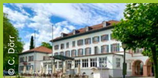
Kurhaushotel Bad Salzhausen