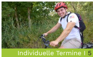
Individuelle Termine | 5