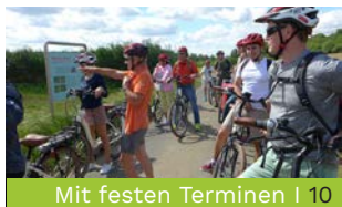
Mit festen Terminen | 20