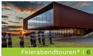
Feierabendtouren* | 6