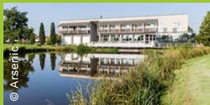
Golfhotel Bad Vilbel