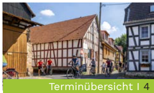
Terminübersicht | 4