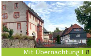
Mit Übernachtung | 8