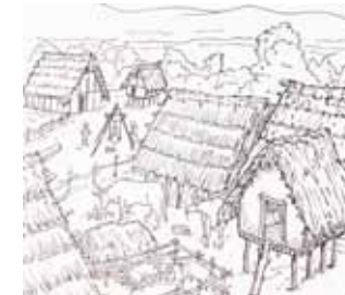
oben: 1. Stopp, Mesolithikum- Bronzezeit links: 2. Stopp Jungstein- u. Eisenzeit