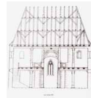
links: 4. Stopp, St.-Remigius-Kirche