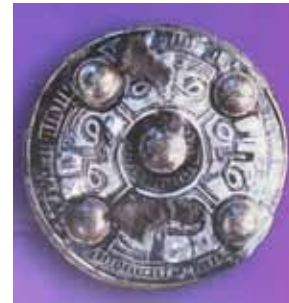
rechts: 3. Stopp, frühmittelalterliches Gräberfeld