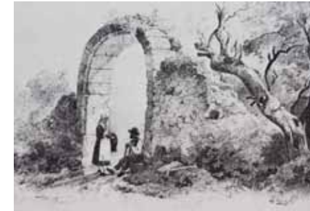
oben: 1. Stopp, bronzezeitliches Gräberfeld links: 2. Stopp mittelalterliche Wüstung Straßheim