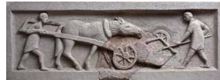
oben: 3. Stopp, mittelneolithische Siedlung und römische Villa rustica