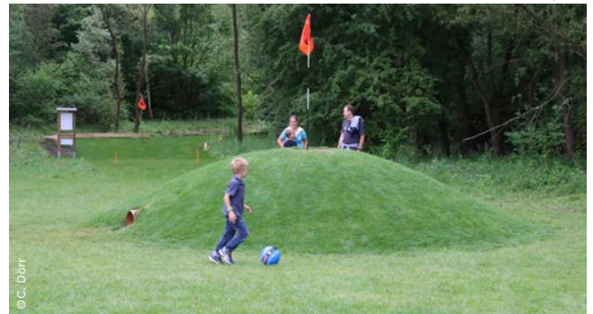
▲ beim Fußballgolf