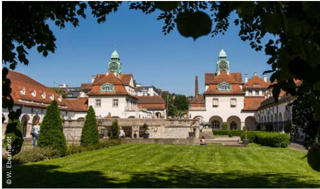
▲ Sprudelhof, Bad Nauheim