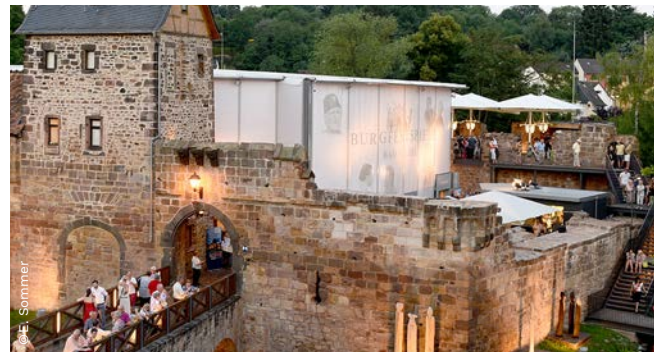
▲ Burgfestspiele, Bad Vilbel