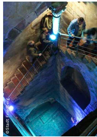
▲ Mikwe, Friedberg