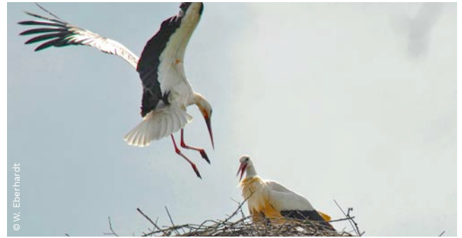
▲ bei vielfältigen Naturbeobachtungen