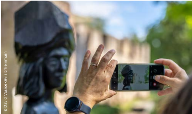
▲ mit kultureller Vielfalt