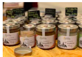
▲ Honig, Aulendiebach

Einen besonderen Reiz bieten die vielen Hof- und Dorfläden in den kleineren Städten und Gemeinden sowie die Bauern- und Wochenmärkte der Region. Eigene Produkte, oft in Bio-Qualität, stehen für Frische und Saisonalität. Das Einkaufen beim Direktvermarkter wird zum Erlebnis, weil man dabei einiges aus dem Bereich Landwirtschaft erfährt.