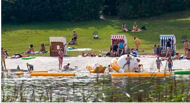
▲ Badespaß, Gederner See