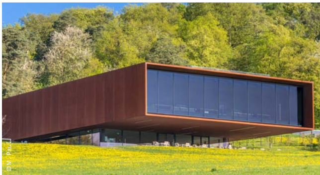
▲ Keltenwelt am Glauberg