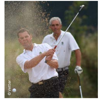
▲ auf attraktiven Golfplätzen