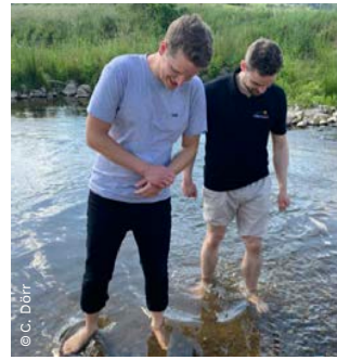
▲ nach Sebastian Kneipp