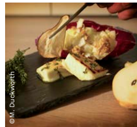
▲ Ducky's Restaurant