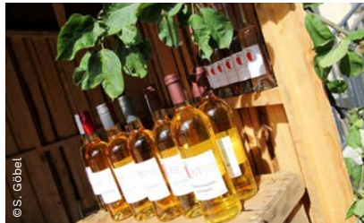
▲ Reise der Sinne, Wölfersheim