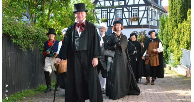
▲ bei spannenden Kultur- und Naturführungen