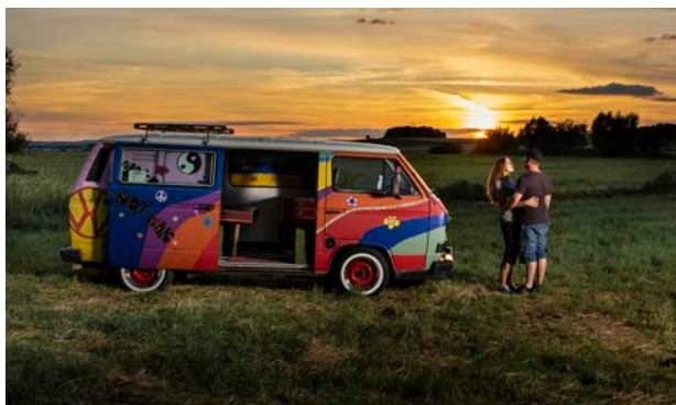
Titel: © Gerti Kuhl