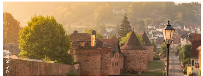
▲ Jerusalemers Tor, Büdingen