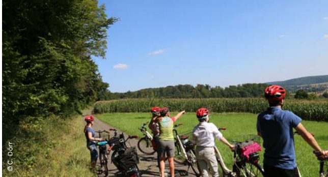
▲ auf über 1000 km Radwegen