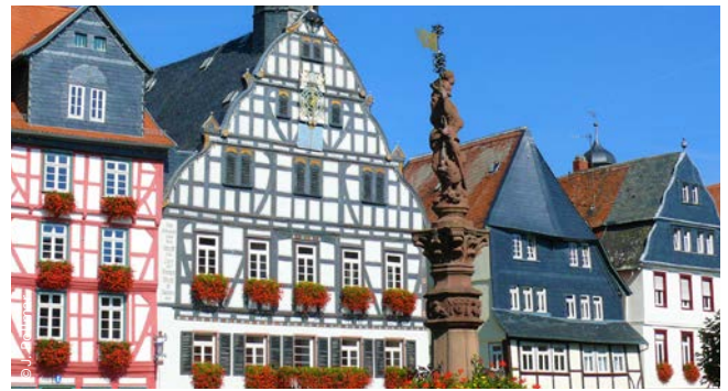
▲ Marktplatz, Butzbach