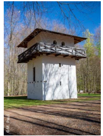
▲ Wachturm, Limeshain